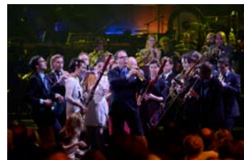
Nederlands Blazers Ensemble